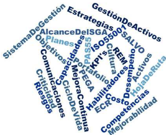
Figura No. 3

La descripción gráfica de ese momento se podría bosquejar como en la figura No. 3.