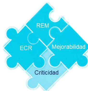
Figura No. 4

Posteriormente, este grupo entendió los conceptos de toma de decisiones con base en costo, riesgo, desempeño y visión del ciclo de vida, a través del uso de las buenas prácticas o metodologías como SALVO - STRATEGIC ASSETS LIFE-CYCLE VALUE OPTIMIZATION y los índices de salud de equipos.